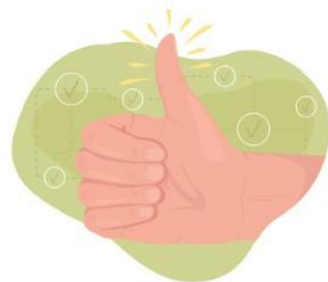
1. Kép

„A kettős szerep = egység + hatékonyság + minőség”